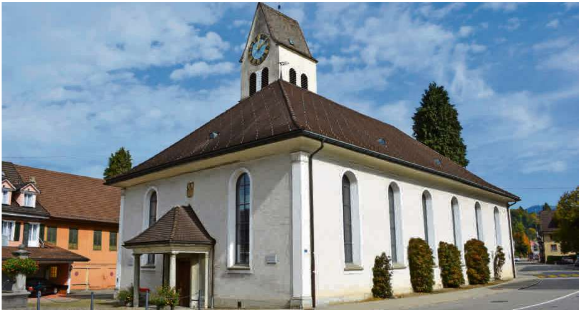
Der Mitgliederverlust der Kirche sei auch eine Chance, glauben Kirchenvertreter.

Die Reformierte Landeskirche der Kantons Zürich versucht dieser Distanz bisher mit strukturellen Anpassungen zu begegnen.