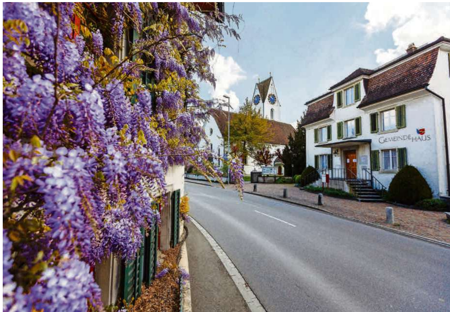
Würde eine Verlegung des Verkehrs zu einer Verödung des Dürntner Dorfsentrums führen?

Ein Votant kritisierte, dass die Arbeiten bereits weit fortgeschritten seien, ohne dass die Bevölkerung bei der Planung ein Wörtchen habe mitreden können. Gemeinderat Boccadamo wies darauf hin, dass die Mitarbeit der Einheimischen daran gescheitert sei, weil sich zu we-